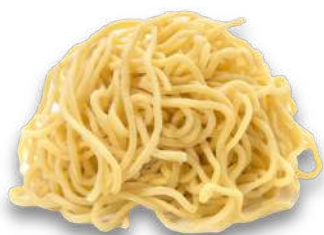
替麺 ¥250(トッピング付)